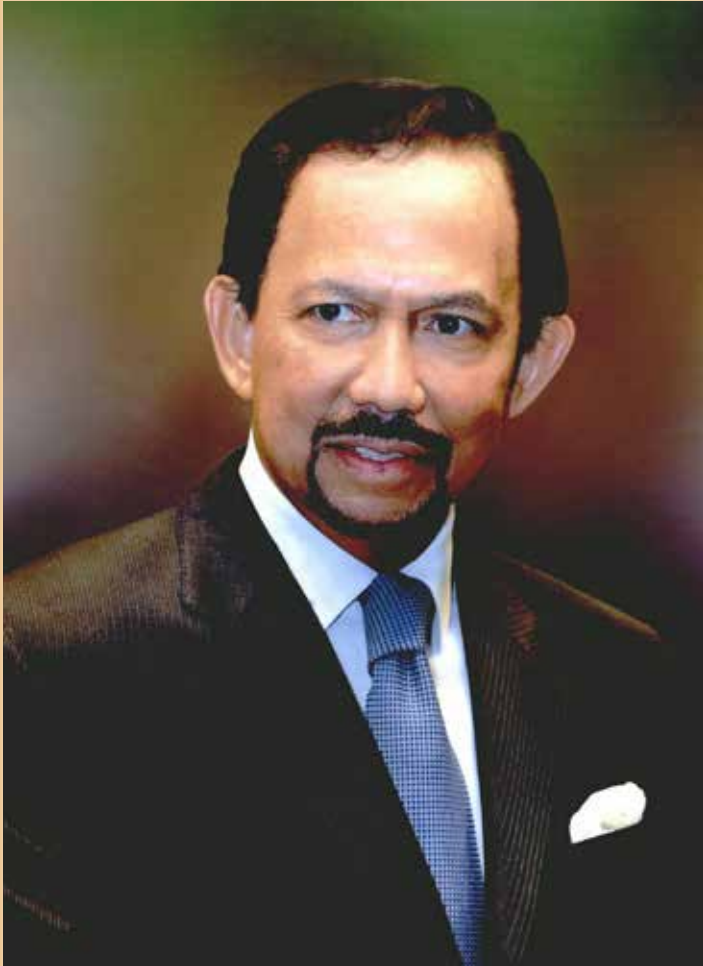
Kebawah Duli Yang Maha Mulia Paduka Seri Baginda Sultan Haji Hassanal Bolkiah Mu'izzaddin Waddaulah ibni Al-Marhum Sultan Haji Omar 'Ali Saifuddien Sa'adul Khairi Waddien, Sultan dan Yang Di-Pertuan Negara Brunei Darussalam