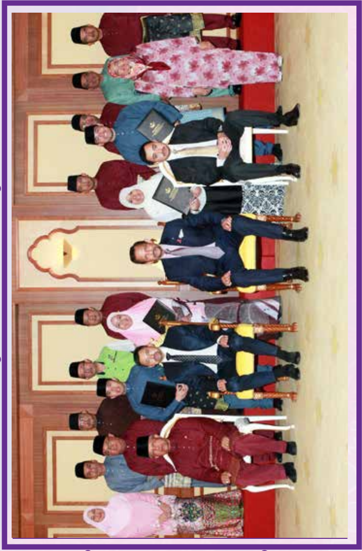
Kebawah Duli Yang Maha Mulia Paduka Seri Baginda Sultan Haji Hassanal Bolkiah Mur'izzaddin Waddaulah, Sultan dan Yang Di-Pertuan Negara Brunei Darussalam dan Kerabat-Kerabat Diraja bersama Penerima-Penerima Anugerah Belia Kebangsaan 2016