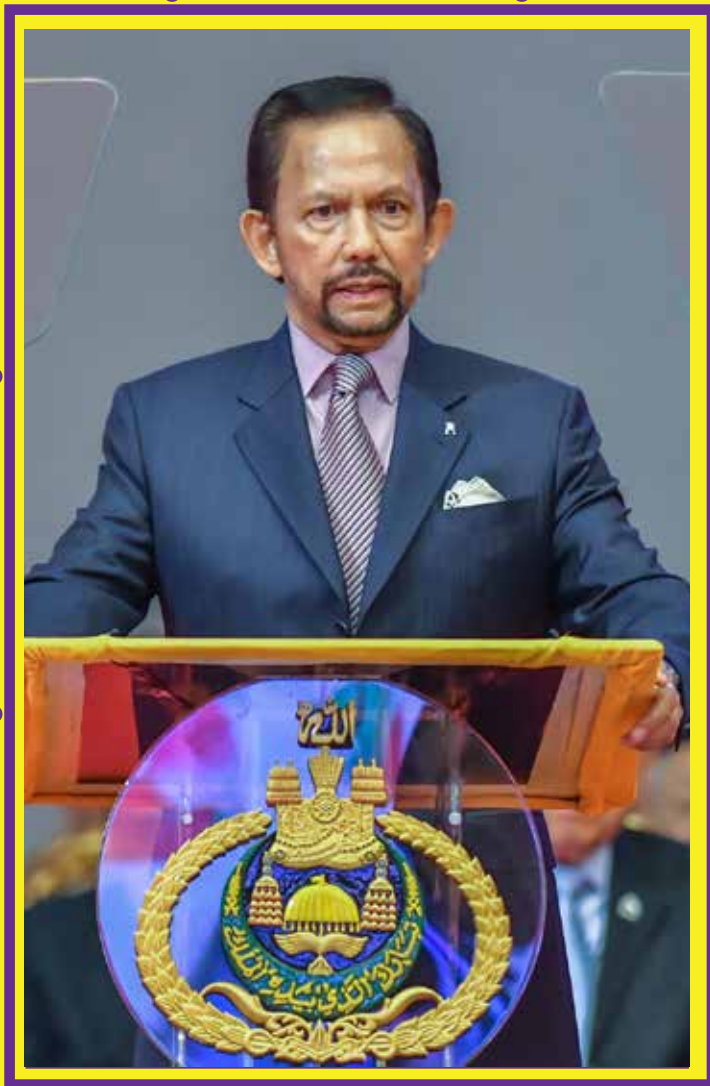
Kebawah Duli Yang Maha Mulia Paduka Seri Baginda Sultan Haji Hassanal Bolkiah Mu'izzaddin Waddaulah ibni Al-Marhum Sultan Haji Omar 'Ali Saifuddien Sa'adul Khairi Waddien, Sultan dan Yang Di-Pertuan Negara Brunei Darussalam Semasa Mengurniakan Titah