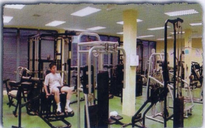
Bilik Kecergasan • Conditioning Room