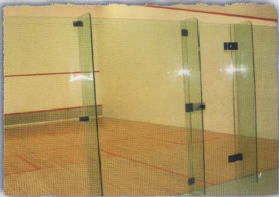
Gelanggang Squash • Squash Court