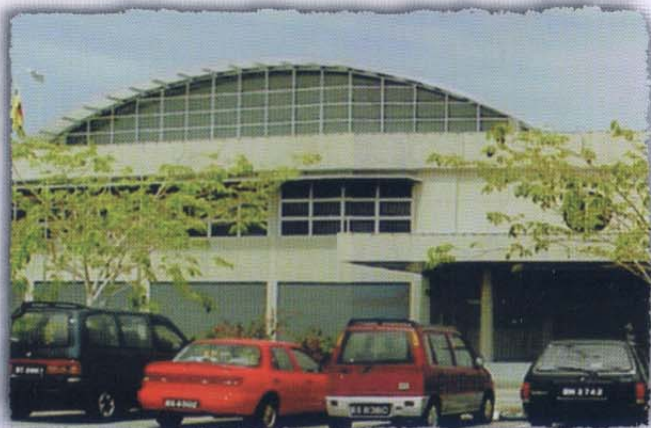
Pintu Utama • Main Entrance