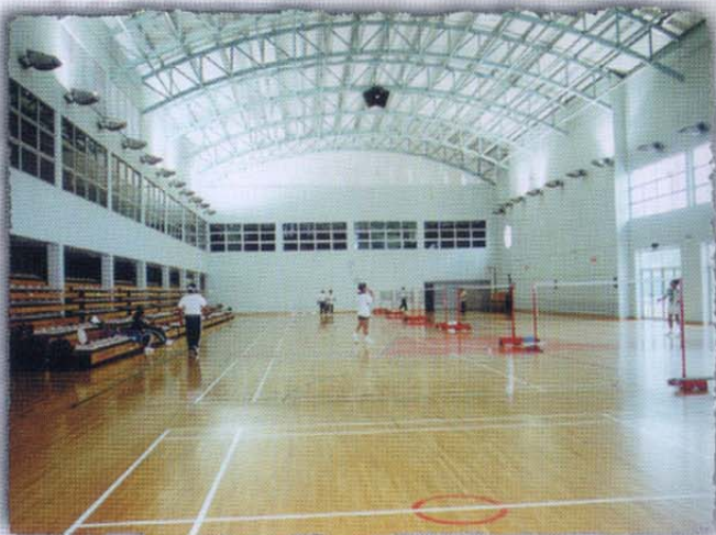
Dewan Utama • Main Hall