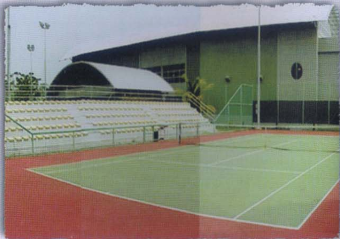
Gelanggang Tenis • Tennis Court