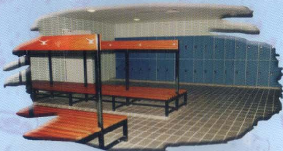
Bilik Persalinan • Changing Room

Penggunaan adalah percuma mengikut jadual latihan dan tertakluk kepada kekosongan.