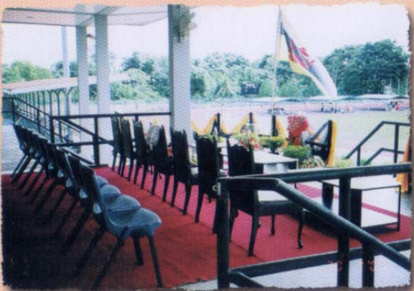
Grandstand untuk VIP • VIP Grandstand