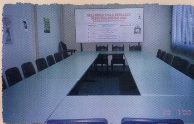
Bilik Mesyuarat • Meeting Room