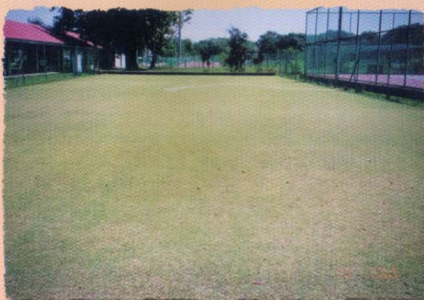
Bowling Padang • Lawn Bowls