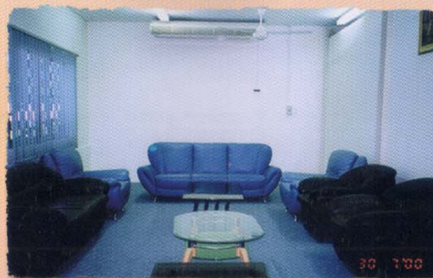
Bilik VIP • VIP Lounge