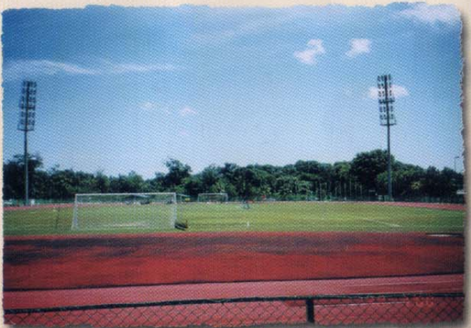
Padang Bolasepak • Football Field