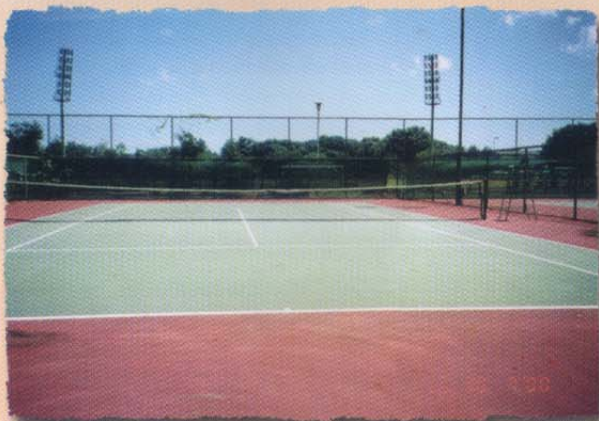
Gelanggang Tenis jenis keras • Tennis Hard Court