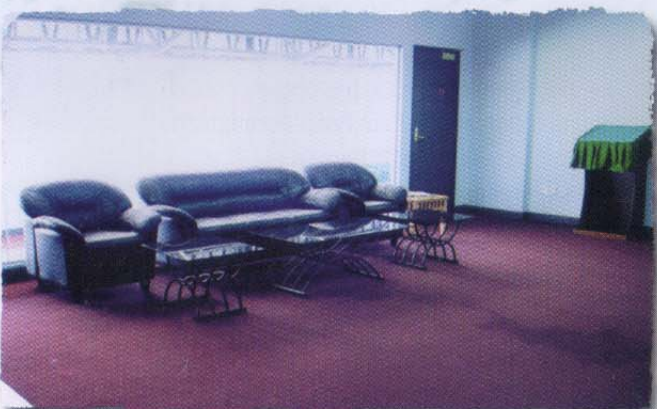
Bilik VIP • VIP Lounge