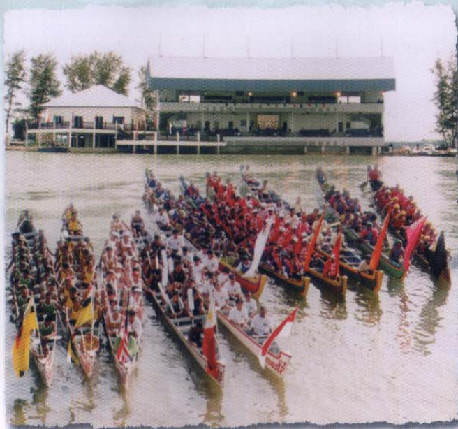
Aktiviti Lumba Perahu