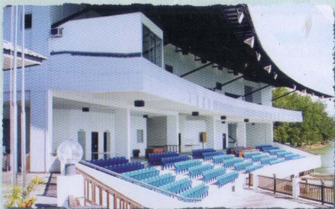
Grandstand • Granstand