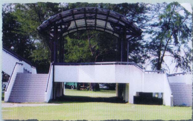
Pintu Masuk Utama • Main Entrance