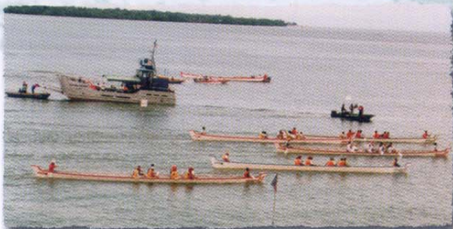
Boat Racing Activities