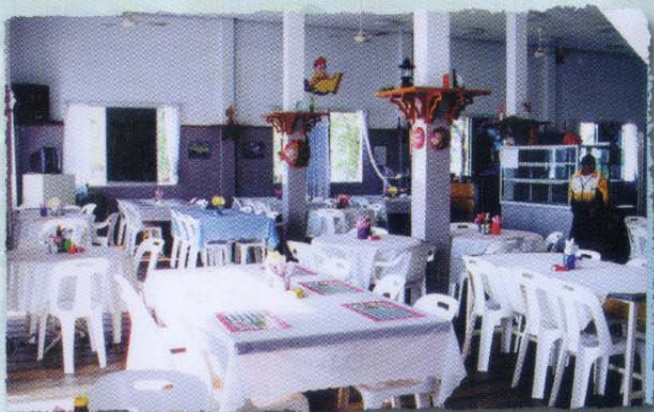
Restoran • Restaurant