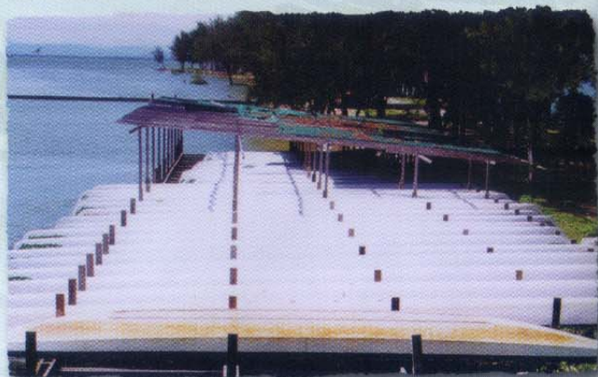
Sediaan Perahu • Boat Storage