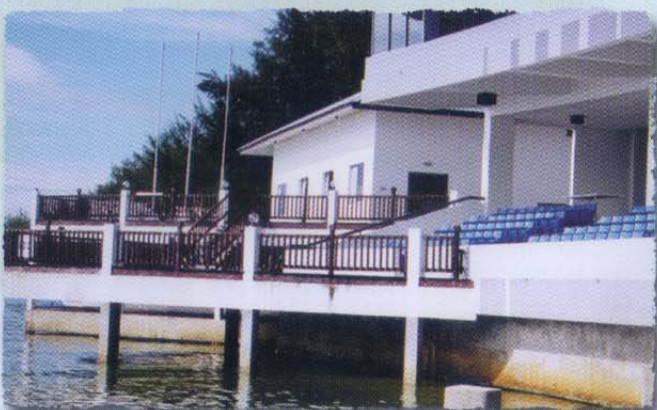
Veranda • Balcony